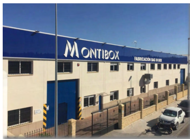
Montilla, Córdoba, Spain